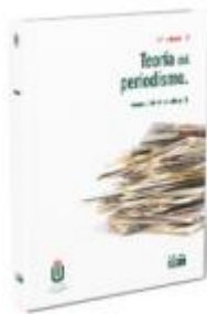
Teoría del periodismo