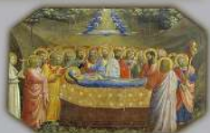
IN TRA ARRETO MILITUM LA NOTICIA